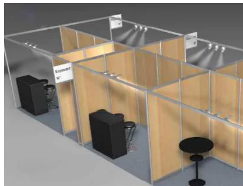
Exemple de stands de 6 m 2 (3 m large x 2 m profondeur), 3 panneaux de fond et 2 cloisons latérales en mélaminé couleur hêtre Dimension d'une cloison : 1 m de large x 2,50 m de haut - Photo non contractuelle