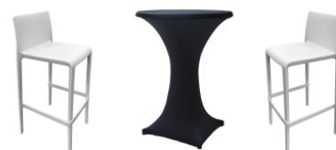
Photo non contractuelle, sous réserve de disponibilité à la date de commande